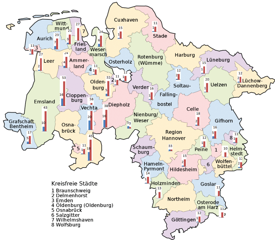
Abb. 1: Standorte und Einzugsgebiete der Viehhändler in Niedersachsen

Unternehmen ergänzt, die im Telefonbuch und den Gelben Seiten sowie bei Bedarf mit Hilfe einer Internet-Suchmaschine auffindig gemacht wurden.